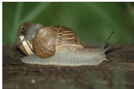
Petit gris

En effet, d'après iNaturalist , seule une quarantaine d'entre eux sont actuellement connus sur le territoire, parmi lesquels le Petit gris - Cornu aspersum (photo). L'espèce la plus observée en vallée de l'Hérault est le bulime tronqué - Rumina decollata , caractérisée par l'extrémité de sa coquille cassée.