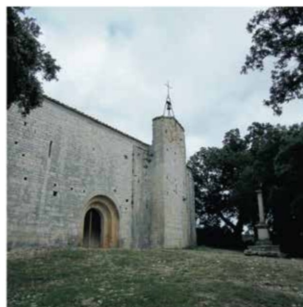
Chantal Chivas La chapelle Saint-Sylvestre.

Le site fait partie du Grand Site de France de Saint-Guilhem-le-Désert qui réorganise les déplacements, restaure, met en valeur et assure la protection des monuments et des espaces naturels remarquables.