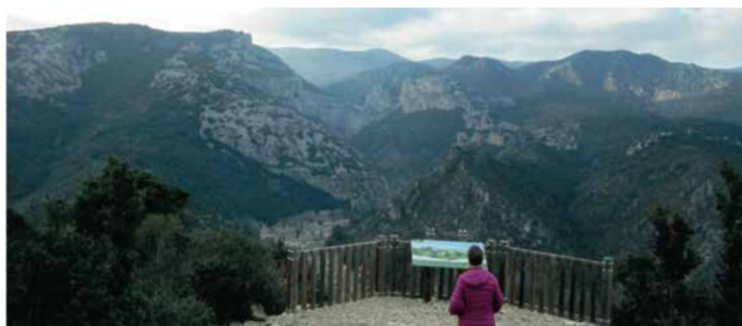
Le cirque de l'Infernet depuis la table d'orientation.