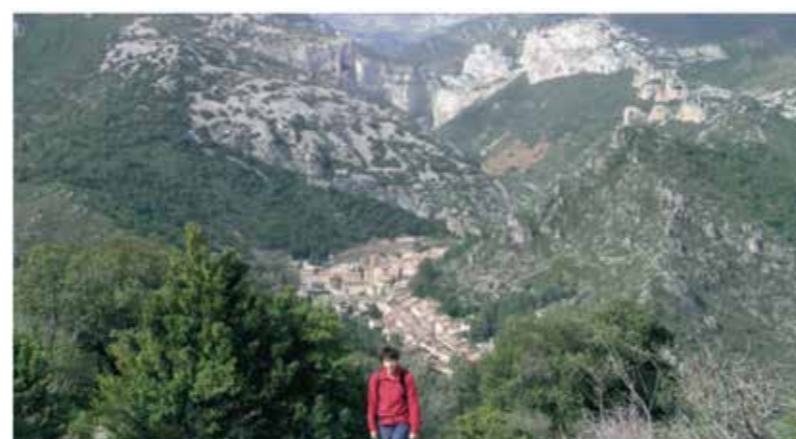
Saint-Guilhem-le-Désert depuis le belvédère du bois des Brousses.